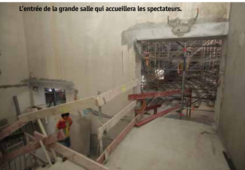
L'entrée de la grande salle qui accueillera les spectateurs.